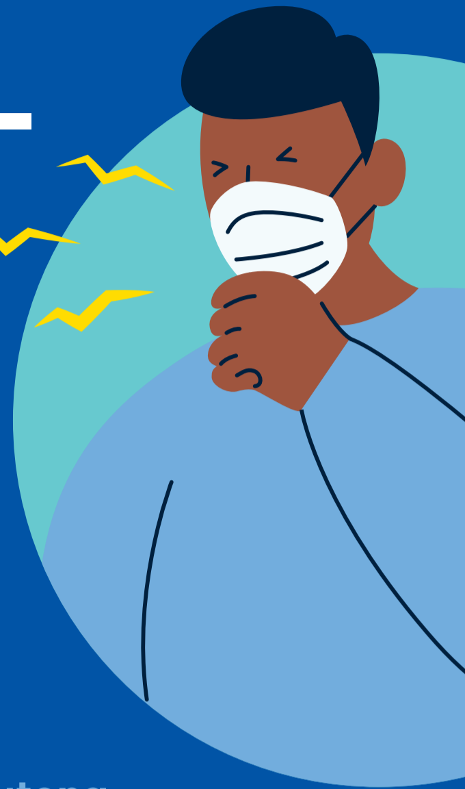
Golwe van COVID-19-gevalle in Gauteng

Dit versprei makliker van persoon tot persoon en het 'n skerp styging in infeksies veroorsaak.